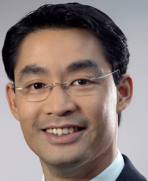
Dr. Philipp Rösler

Vize-Kanzler und Bundesminister für Wirtschaft und Technologie