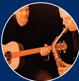
the network livemusik